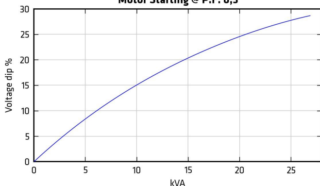
Motor Starting @ P.F. 0,3