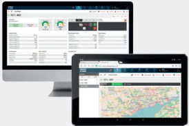
interface de Télégestion et supervision

Des accessoires «plug & play» faciles à installer et livrés avec leur notice de montage, pour s'adapter à tous les marchés.