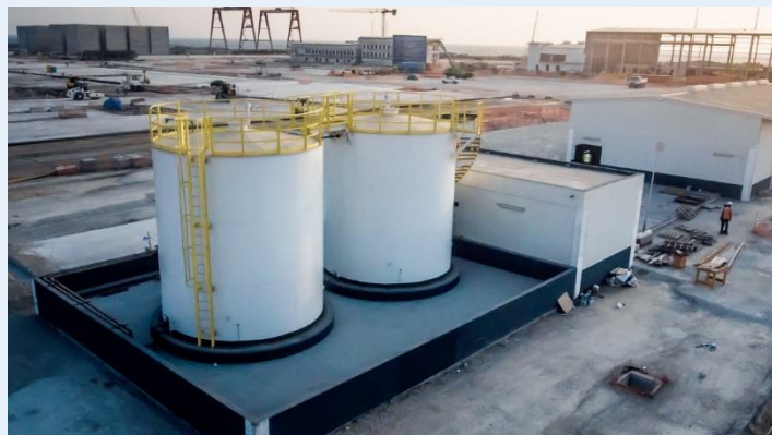
Cuves de carburant

Une station de dépotage de carburant avec compteur volumétrique complète l'ensemble et permet de décharger un camion de carburant en 1 heure.