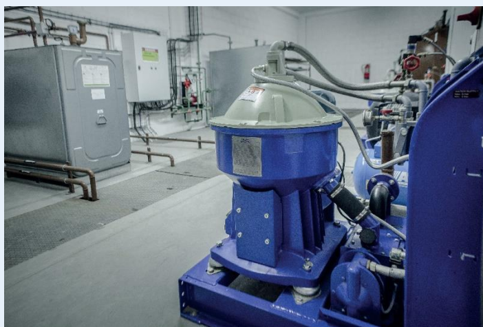
Local de traitement des fluides

Le local de traitement du carburant abrite également 2 cuves de 1000 L : une pour l'huile neuve et une pour l'huile usagée, avec une pompe pour réaliser les appoints et les vidanges. Une troisième cuve, d'une capacité de 1500 L cette fois, est dédiée au liquide de refroidissement.