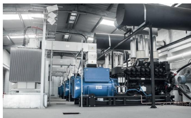
Vue intérieure de la centrale de 4 groupes électrogènes