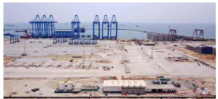
Vue extérieure de la centrale de secours au premier plan avec les deux cuves de carburant à gauche et le bâtiment qui abrite les 4 groupes électrogènes au centre

Le groupe Eiffage intervient sur plusieurs aspects du projet et en particulier sur la partie électrique du port via sa filiale allemande RMT. C'est donc en partenariat avec RMT que KOHLER-SDMO a proposé la centrale d'énergie de secours pour équiper le nouveau port de Tema.