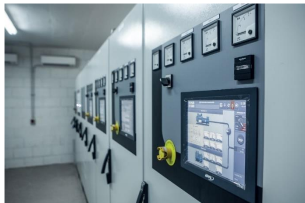
Local des armoires de contrôle/commande de la centrale

Le nouveau port entrera en service en juin 2019 et à l'avenir, la centrale de secours pourrait être étendue à 10 groupes électrogènes si cela s'avère nécessaire.