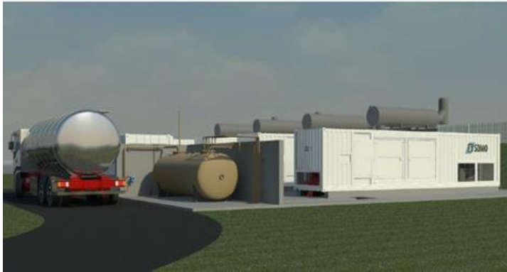
Ilustr. 1. Plan de instalación de los cuatro grupos electrógenos

La central de energía se encuentra al pie del barranco del Pas du Roc, a la entrada de la galería, para poderse conectar a las bombas de evacuación de agua. El nivel sonoro de la instalación fue objeto de una atención especial, ya que se encuentra a unos centenares de metros de las viviendas.