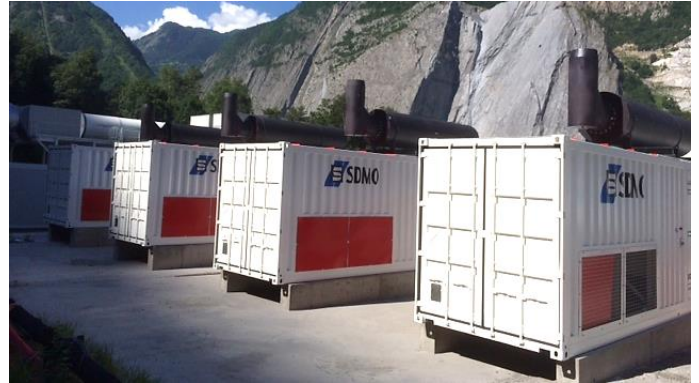
Ilustr. 2. Los cuatro grupos electrógenos de 1900 kVA instalados al pie del barranco del Pas du Roc

KOHLER-SDMO ofrece soluciones llaves en mano que abarcan hasta la instalación in situ o también la posibilidad de un acompañamiento en la realización del proyecto a través del suministro de planes. Esta segunda opción fue la elegida por la agrupación de empresas para conseguir una instalación perfectamente funcional. La central de energía estará presente en la obra durante los cuatro años de trabajos y luego se cederá a la empresa Tunnel Euralpin Lyon Turin (TELT), promotora de los trabajos.