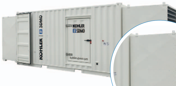
Cajones para la absorción del ruido