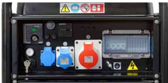
Панель розеток Technic 15000 TE AVR