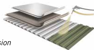
Protection anti-corrosion des conteneurs

Sur ses conteneurs, KOHLER-SDMO propose un traitement peinture extérieur de niveau C4 à C5M (selon l'ISO 12944) adapté à une atmosphère de corrosivité élevée à très élevée pour une installation en zone industrielle et côtière ou en bord de mer.